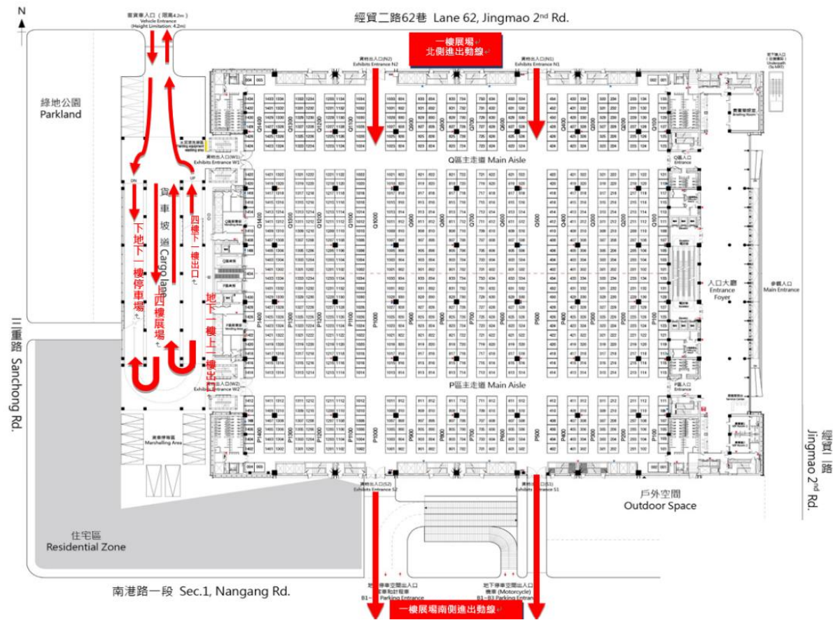
圖四：進場期間&6月2-3日貨車進入4樓展場路線