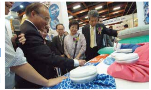
Exhibitor explains details of their products to the distinguished guests in the showground.