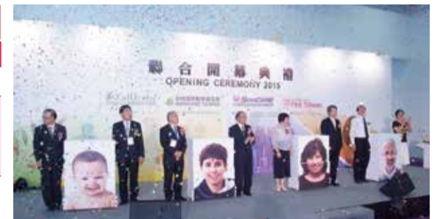
Grand opening ceremony of Medicare Taiwan, TaiHerbs, SenCARE and P&B Taiwan.