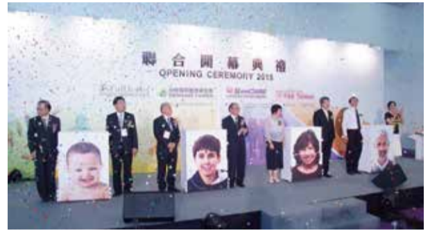
醫療四展開幕，展示「人生全程照護」全方位展品。